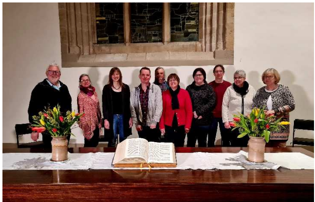
Die künftigen Lektoren und Lektorinnen nach 4 Stunden intensiver Predigtarbeit in unserer Kirche

Bitte kommen Sie am 24.4. um 10:30 Uhr zu diesem Gottesdienst in die Jakobi-Kirche und begrüßen unsere künftigen Lektor*innen!